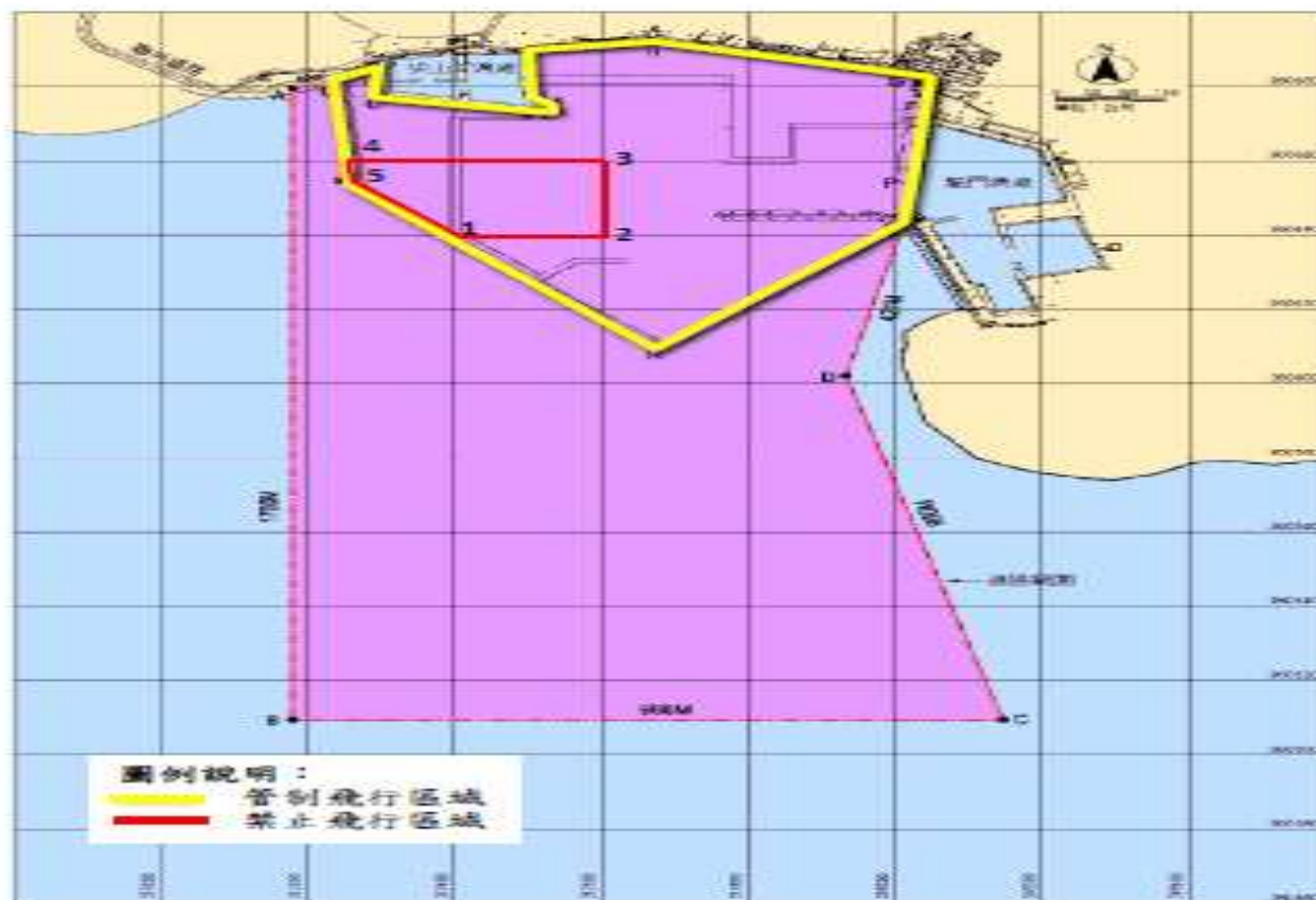
澎湖港(龍門尖山碼頭區)