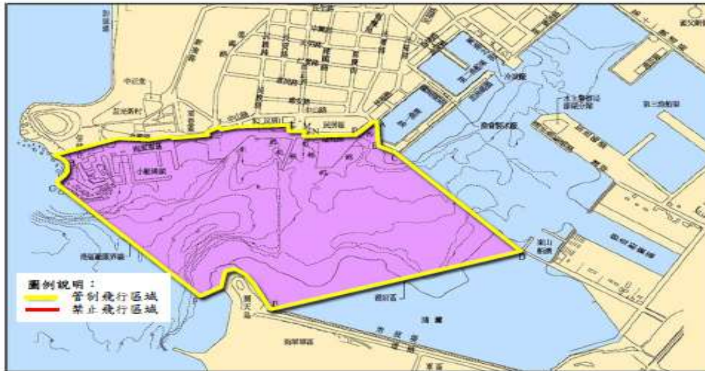
澎湖港(馬公碼頭區)