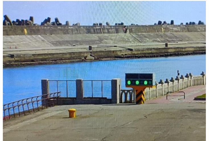
圖 3 - #1 碼頭北端航道警示燈號