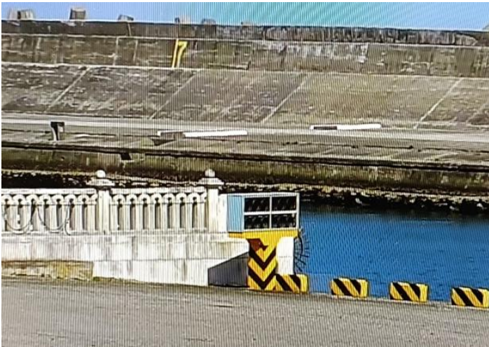
圖 2 - #17 碼頭南端航道警示燈號