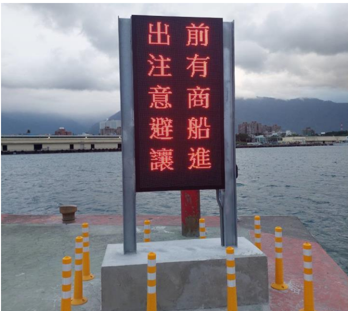
圖 4 - 漁港堤口警示燈牌